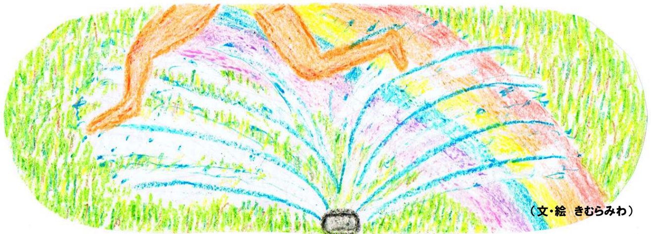
(文・絵 きむらみわ)

そしてそれらの思いは、マイクを向ける人さえいれば、公に還元される大きな力になるということも。