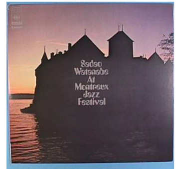
モントルー・ジャズ・フェスティバルの…／渡辺貞夫