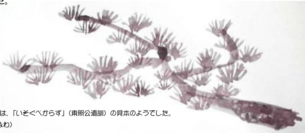
岡崎公園の大黒松は、「いぞくべからず」（東照公遺訓）の見本のようでした。