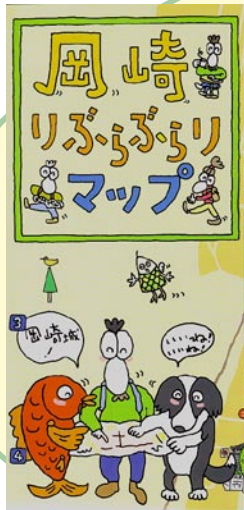
岡崎りぶらぶらりマップ