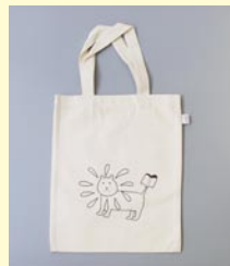
コットンバッグ 「りぶらいあん」 260 × 330 (mm)