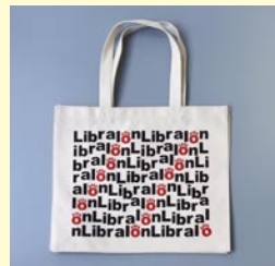
トートバッグ 「Libra | on」 360 × 300 × 140 (mm)