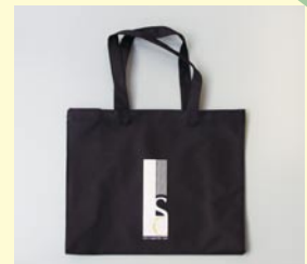
トートバッグ 「りぶらサポータークラブ」 360 × 300 × 140 (mm)

トートバッグ 1,000円 コットンバッグ 500円 缶バッジ 100円 9/27 : 福祉まつり (中央総合公園) で販売 11/1 から : Libra 市民活動センターで販売