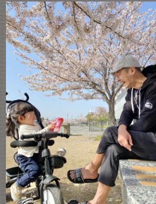
昨年のグランプリ作品